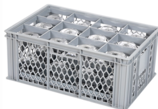
Glazen in kisten