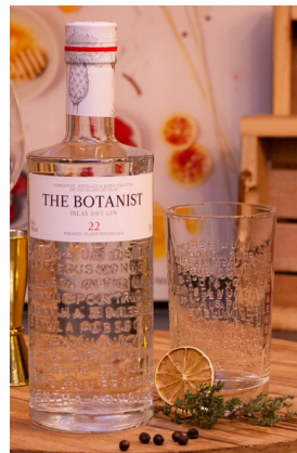
Gin & Tonic